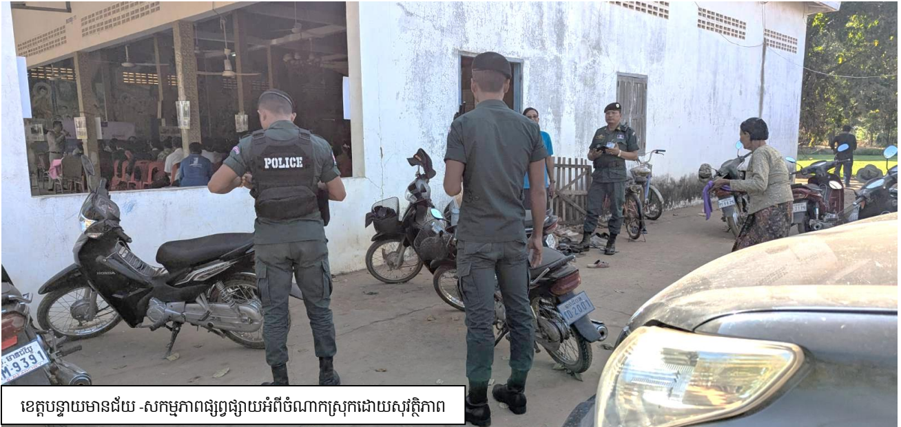
ខេត្តបន្ទាយមានជ័យ - សកម្មភាពផ្សព្វផ្សាយអំពីចំណាកស្រុកដោយសុវត្ថិភាព