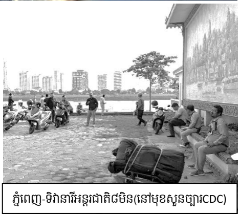
ភ្នំពេញ-ទិវានារីអន្តរជាតិ៨មីន(នៅមុខស្ថានីយ៍ច្បារចេញCDC)