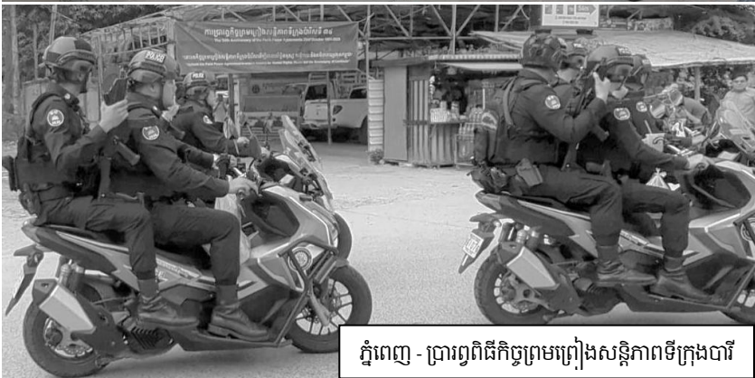
ភ្នំពេញ - ប្រារព្ធពិធីកិច្ចព្រមព្រៀងសន្តិភាពទីក្រុងប៉ារី