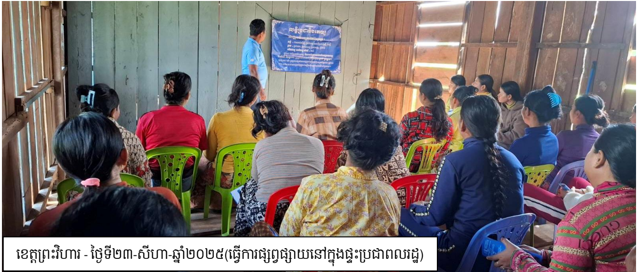
ខេត្តព្រះវិហារ - ថ្ងៃទី២៣-សីហា-ឆ្នាំ២០២៥(ធ្វើការផ្សព្វផ្សាយនៅក្នុងផ្ទះប្រជាពលរដ្ឋ)

របាយការណ៍ឆ្នាំ២០២៥ ៣ សកម្មភាពផ្សព្វផ្សាយអំពីប្រជាធិបតេយ្យ សិទ្ធិពលរដ្ឋ និងសិទ្ធិនយោបាយ មានចំនួន៨១វគ្គ។ ក្នុងនោះ ៧៥% (៦១វគ្គ) នៃ៨១វគ្គ ត្រូវបានអាជ្ញាធរមូលដ្ឋាន ៤ វិតក្សិត និងអនុវត្តសកម្មភាពដែលប៉ះពាល់ដល់សិទ្ធិសេរីភាពបញ្ចេញមតិតាមរយៈការជួបជុំដោយសន្តិវិធី ក្នុងចំណោមនោះមាន៖